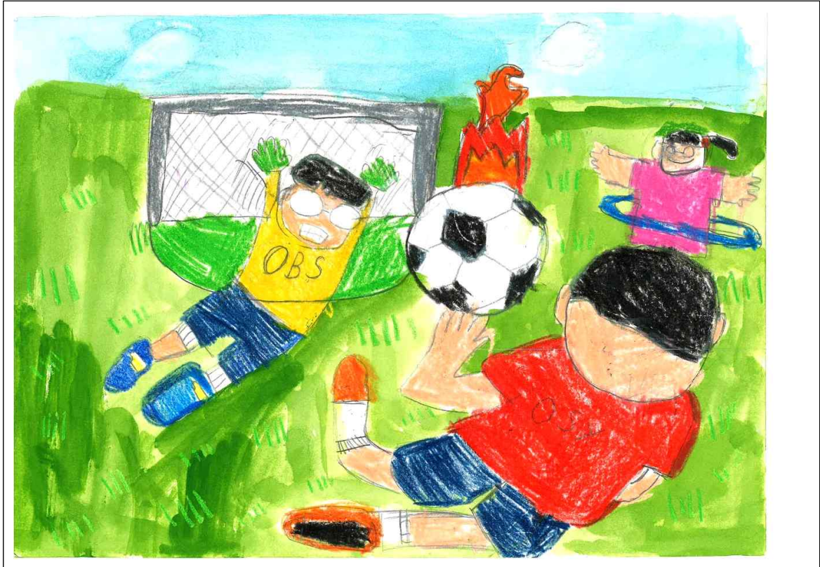
□ 장려상_담배 악마 퇴치작전 (초등부 고학년 배지윤)