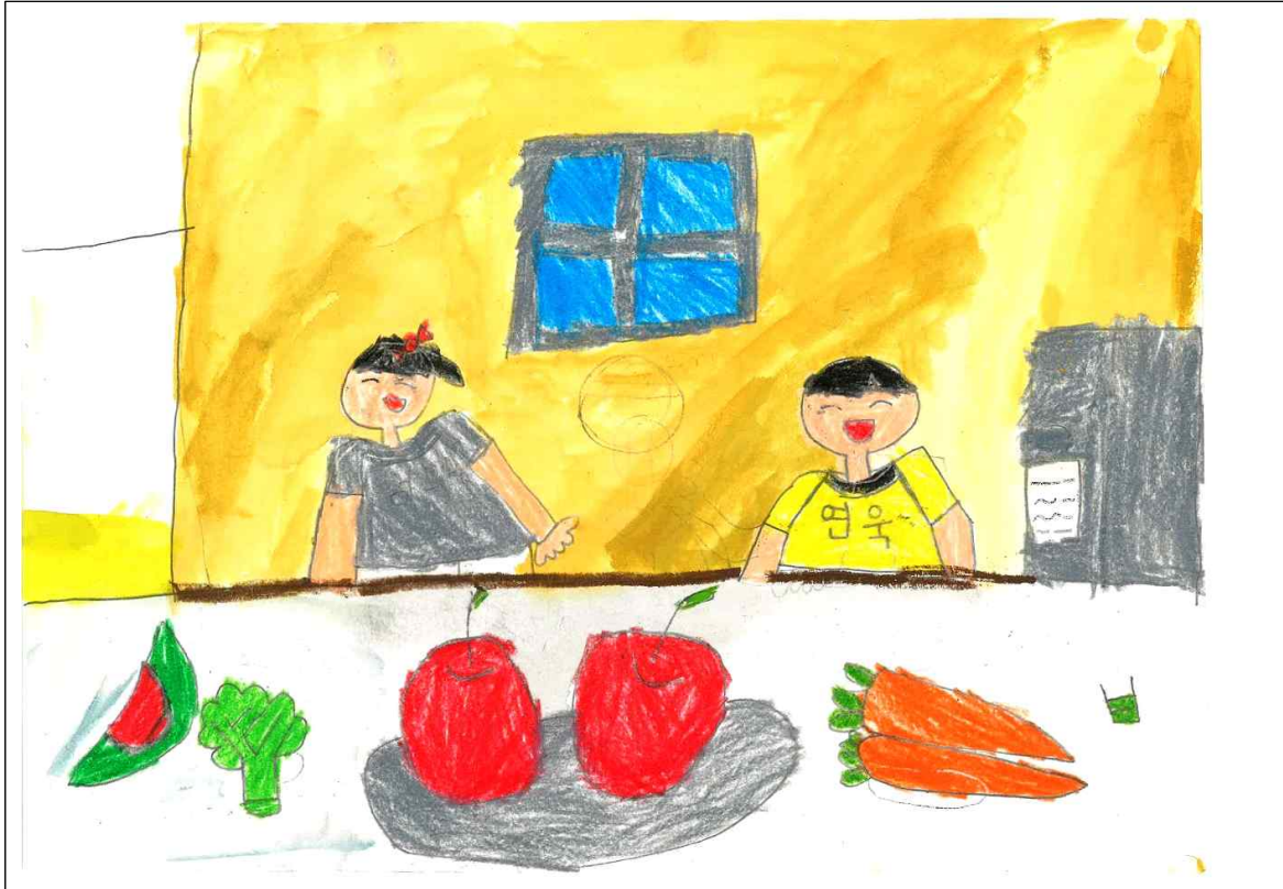
□ 장려상_건강해지기 (초등부 저학년 유진아)